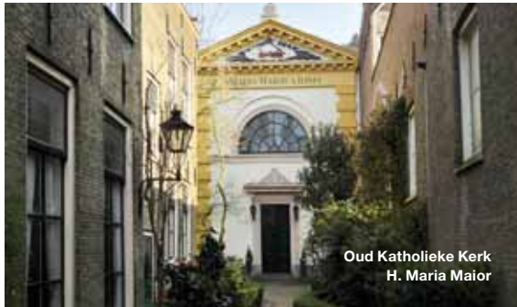
Oud Katholieke Kerk H. Maria Maior

Verscholen achter een hek en een voortuin met bomen staat een markant kerkje (nr. 120). De Oud Katholieke Kerk H. Maria Maior 34 is een schitterend voorbeeld van neoclassicistische bouwkunst. Het ontwerp komt uit de pen van de Dordtse stadsbouwmeester G.N. Itz. Het kerkje staat op de plek van een vroegere schuilkerk. Na de Reformatie kwamen parochianen hier 'in het geheim' bijeen. Het calvinistische stadsbestuur gedoogde de situatie en liet de tientallen katholieken samenkomen. De kleine kerkgemeenschap zorgde in 1723 zelf voor versnippering als gevolg van een interne richtingenstrijd.